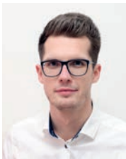
JOOSTEN BRANDTSTÄDTER GESCHÄFTSFÜHRER

Pflege ist Vertrauenssache. Deshalb möchten wir uns mit dieser Publikation gerne bei Ihnen vorstellen und Ihnen einen Einblick in unsere Leistungen und Konzeption geben.